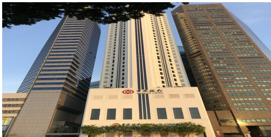
中国银行新加坡分行