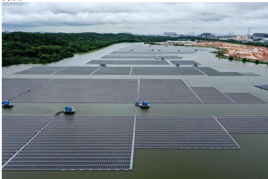
中国能源建设集团山西公司承建登加蓄水池水上光伏项目

体施工工作已完成，全面进入系统调试阶段，预计于6月并网发电。本项目是目前世界最大的淡水水库浮体光伏项目之一，也是新加坡首个大型光伏电站，项目将为新加坡2025年光伏发电达到1.5GW峰值的目标做出积极贡献。