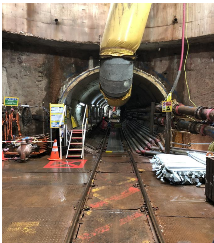
上海隧道在建项目