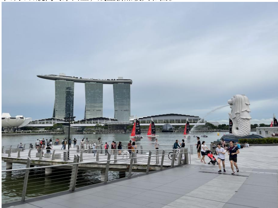
新加坡鱼尾狮公园

新加坡古称淡马锡。8世纪属室利佛逝王朝，18-19世纪是马来柔佛王国的一部分。1819年英国人史丹福·莱弗士抵达新加坡，与柔佛苏丹签约，开始在新加坡设立贸易站。1824年新加坡沦为英国殖民地，成为英国在远东的转口贸易商埠和东南亚的主要军事基地。1942年被日本占领。1945年日本投降后，英国恢复殖民统治，次年划为其直属殖民地。1959年实现自治，成为自治邦，英国保留国防、外交、修改宪法、宣布紧急状态等权力。1963年9月16日与马来亚、沙巴、沙捞越共同组成马来西亚联邦。1965年8月9日脱离马来西亚，成立新加坡共和国。