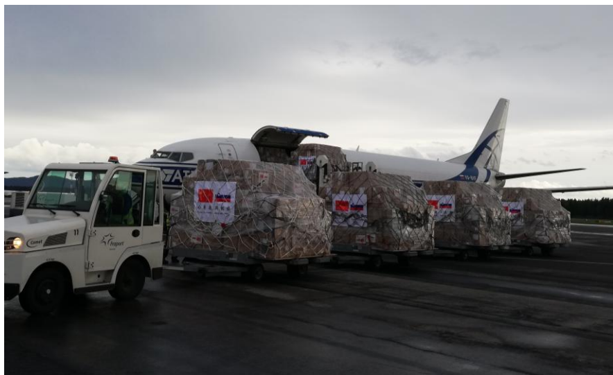
中国政府援助斯洛文尼亚物资

斯洛文尼亚出现新冠肺炎疫情后，中国对斯洛文尼亚提供医疗援助。2020年5月1日，中国政府援助斯洛文尼亚政府的医疗物资运抵卢布尔雅那国际机场。这批物资包括3万只医用N95口罩、70万只外科口罩、2万件一次性隔离服、1万副医用护目镜和3万双一次性橡胶医用手套，重约12吨。