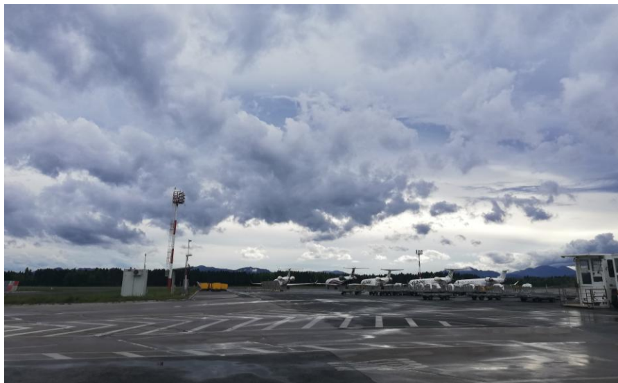
斯洛文尼亚卢布尔雅那国际机场

卢布尔雅那机场是斯洛文尼亚最主要的国际机场，同欧洲十几个国家有固定航线，距首都卢布尔雅那仅25公里。除此之外，在第二大城市马里博尔和海滨城市“玫瑰港”（PORTOROSE）有两个国际机场。2020年斯洛文尼亚航空业较2019年大幅下降，机场运送旅客28.78万人次，同比下降83.3%；国际货物运输1.06万吨，同比下降7%。2019年10月，斯洛文尼亚地区航空公司亚德里亚航空公司破产。