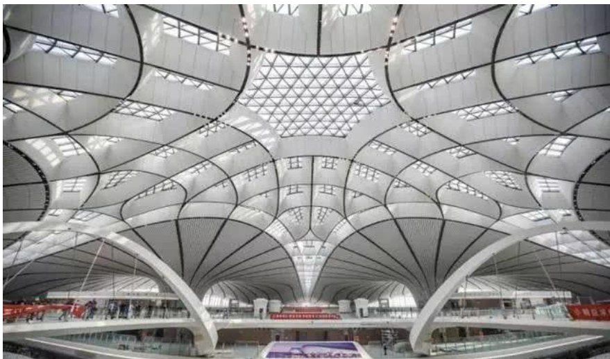
瑞客矿物漆被用于北京大兴新机场核心区域

(1) 里加油漆涂料工厂 (Riga Varnish and Paint Factory)：是波罗的海地区最大的油漆涂料和清漆生产厂家，成立于1898年。该工厂生产的瑞客矿物漆以环保、色正、抗菌等优良特性受到中国消费者的欢迎。现已被应用于北京大兴新机场航站楼10万平方米的核心区域并正参与哈尔滨市老城改造。同时，该矿物漆也被广泛应用于学校、办公场所和医院等墙壁的粉刷。2020年6月8日，拉脱维亚驻华大使马尼卡女士走进直播间，参加由宁波市政府与电商平台拼多多共同举办的“外交官直播，全球购好货”中东欧优品云上展直播推介活动，亲自推介包括瑞客矿物漆在内的拉脱维亚特色产品。拉驻华使馆商务参赞英格先生与拉脱维亚里加油漆涂料工厂亚太区总裁史文杰先生共同向拼多多平台的消费者介绍了瑞客环保矿物漆的品牌背景、产品特点和优越性能。2021年2月中国-中东欧国家领导人峰会期间，里加油漆涂料工厂与苏州金螳螂建筑装饰股份公司、中国-中东欧（沧州）中小企业合作区和哈尔滨市政府等签署的三项合作协议被列入峰会商业合作文件成果清单。