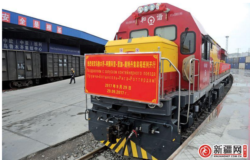
驶向波罗的海的中欧班列

2016年11月，第一列中欧班列(义乌—里加)抵达里加。2017年5月，从里加始发、经哈萨克斯坦到中国喀什的首趟铁路货运班列开行。2017年10月，中欧班列(乌鲁木齐—里加—鹿特丹)抵达里加，开辟了中欧班列“东联西出”铁海联运新通道。2018年，武汉-里加、西安-里加中欧班列抵达里加。