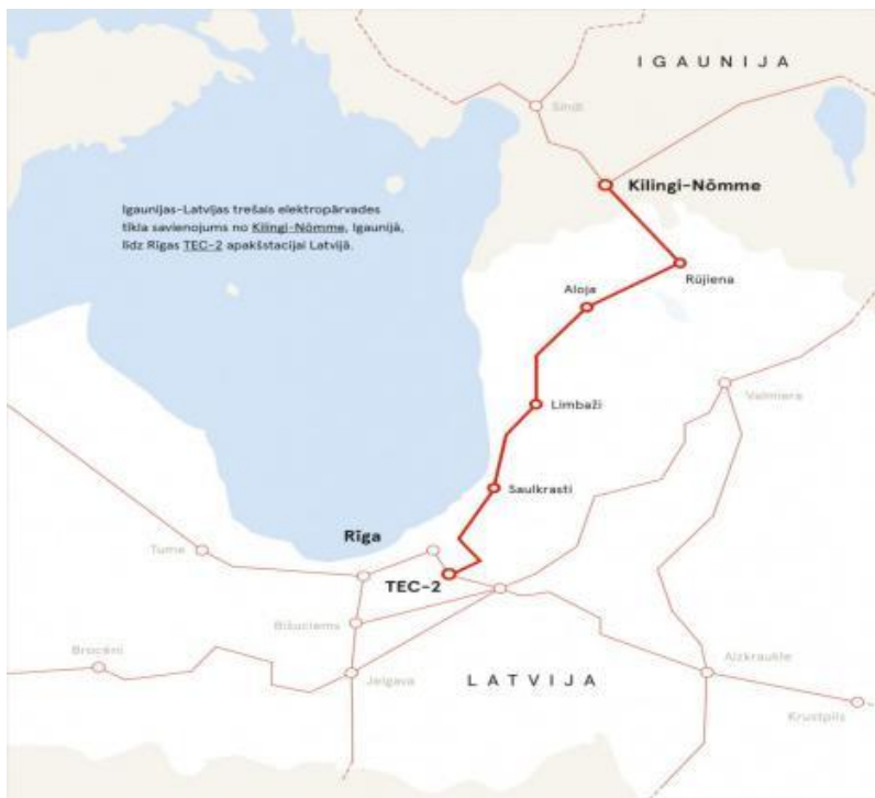
第三条拉脱维亚-爱沙尼亚330伏高压输变电线路

拉脱维亚国家电网已在北欧电力交易所（Nord Pool Spot）上市。中资企业来拉脱维亚投资设厂不需要自备发电设备。