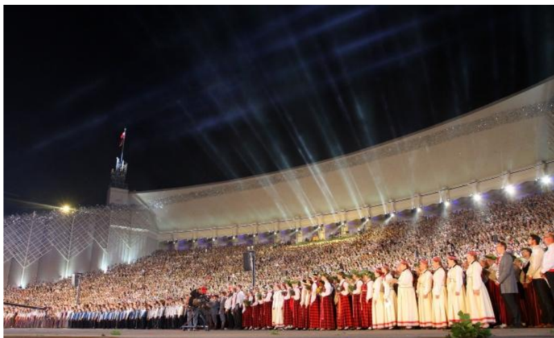
每4年举办的拉脱维亚合唱和歌舞节