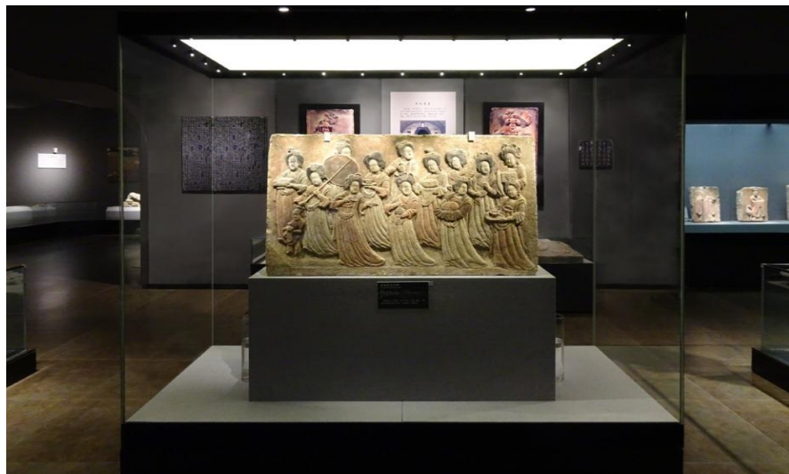
Groglass产品应用于河北省博物馆

(5) 拉脱维亚黑药酒公司 (Latvijas balzams)，成立于1900年，现属于琥珀饮料控股集团，是波罗的海地区最大的酒精饮料生产商，旗下130多种品牌产品出口至全球170多个市场，名牌产品为里加黑药酒 (Riga Black Balsam)，由多种传统草药加入纯伏特加制作而成。