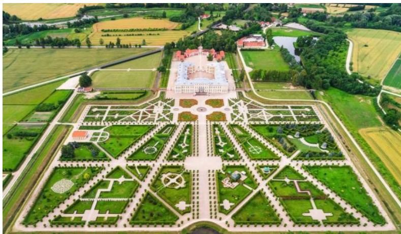
创建于18世纪的隆达列宫是拉脱维亚最知名的旅游景点之一