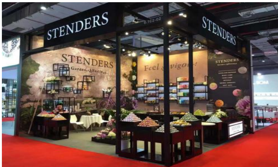
首届进博会期间STENDERS施丹兰展台形象

（4）格林戴克斯（Grindex）制药集团：是波罗的海三国制药行业的龙头企业，经营范围包括药品研发、生产、销售等，2015年9月就催产素注射剂供应与世界卫生组织（WHO）签署长期合作协议。集团产品已出口到87个国家和地区，在拉脱维亚、爱沙尼亚、斯洛伐克有4家子公司，在11个国家（地区）设有代表处。2020年，该集团营业额达1.87亿欧元，同比增长32%；利润为1900万欧元，同比增加4%。