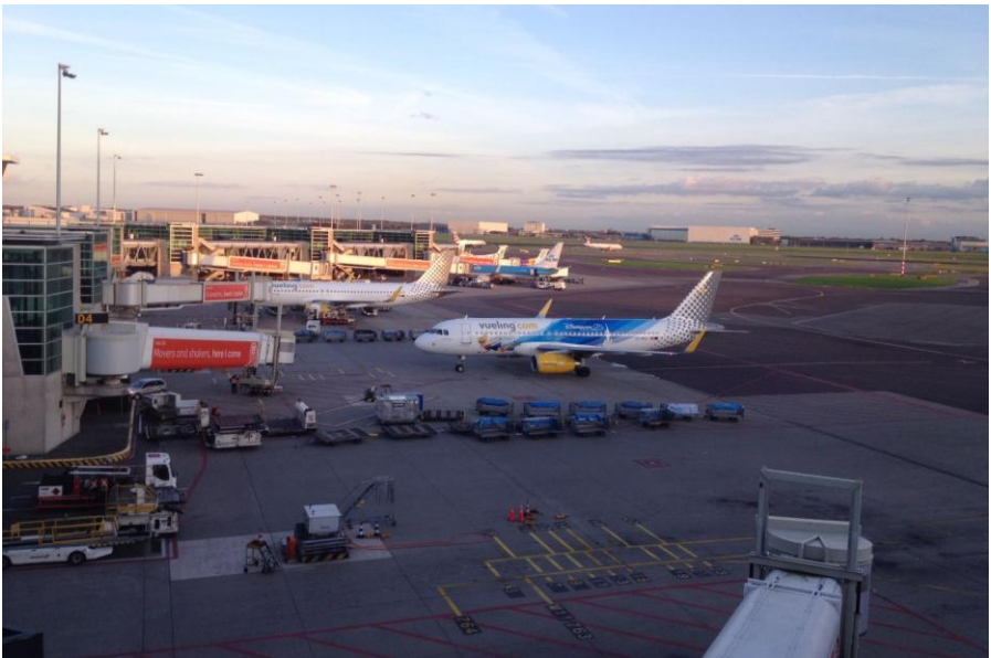
阿姆斯特丹史基浦机场

阿姆斯特丹史基浦国际机场多年来一直是欧洲四大航空枢纽之一，已经与近100个国家的332个机场间建立了直航。鹿特丹、埃因霍温、马斯特里赫特、莱力斯塔等城市有4个中央政府管理的机场，主要停靠往返于欧洲地区国家的廉价航班；登海尔德和埃因霍温有两个军民两用机场；此外还有12个省级政府管辖的小型民用机场。