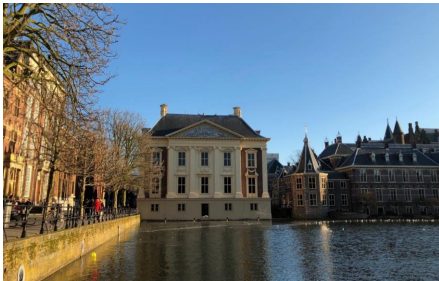
海牙莫里茨博物馆

【发展简史】荷兰1463年正式成为国家，16世纪前长期处于封建割据状态。16世纪初受西班牙统治，1568年爆发延续80年的反抗西班牙统治的战争。1581年北部七省成立荷兰共和国（正式名称为尼德兰联省共和国）。1648年《威斯特伐利亚和约》的签署使西班牙正式承认荷兰独立。17世纪成为海上殖民强国，经济、文化、艺术、科技等各方面均非常发达，被誉为该国的“黄金时代”。18世纪后，殖民体系逐渐瓦解，国势渐衰。1795年法军入侵，1810年并入法国，1814年脱离法国，翌年成立荷兰王国（1830年比利时脱离荷兰独立）。1848年成为君主立宪国。第一次世界大战期间保持中立。第二次世界大战初期，荷兰宣布中立。1940年5月被德国军队侵占，王室和政府迁至英国，成立流亡政府。1945年恢复独立，战后放弃中立政策，加入北约和欧共体及后来的欧盟。