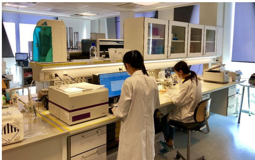
欧洲华大基因有限公司实验室