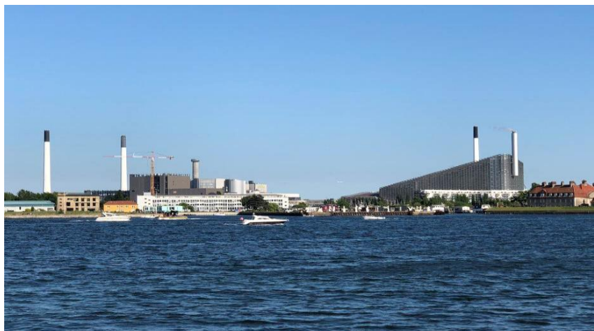
洁高丹麦阿迈厄岛资源中心

丹麦风力发电研究始于1981年，是世界上最早开展风力发电研究和应用的国家之一。经多年发展，丹麦在风电产业和风机制造业已形成一定规模，并具备相当的竞争力。2020年，风电占丹麦全国电力总消费的48%，位居全球第一。