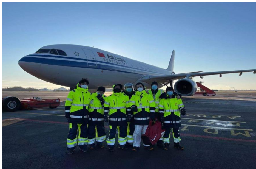
国航哥本哈根营业部