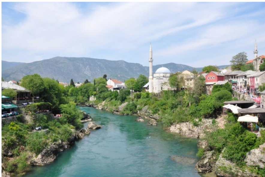
莫斯塔尔市的内雷特瓦河畔风光