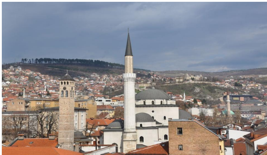
萨拉热窝市中心的贝戈瓦清真寺

波黑极具特色的大众传统风味小吃：一是“切瓦比”（一种牛羊肉丸拌洋葱夹面囊饼）；二是布雷克馅饼。