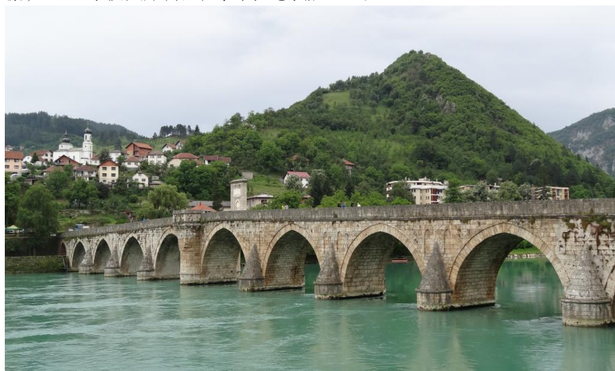
波黑维舍格勒老桥

【旅游产业】波黑将旅游业列为经济发展的重要产业之一。2020年，受新冠肺炎疫情影响，波黑接待旅游人数49.8万人次，同比下降69.7%；过夜天数123.6万天，同比下降63.4%。其中，中国游客4897人次，同比下降81%；过夜天数7983天，同比下降93.5%。根据国际货币基金组织数据，2020年波黑旅游业产值同比萎缩6.5%。