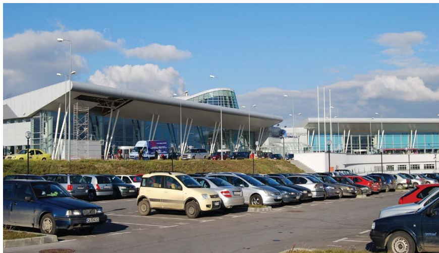
保加利亚首都索非亚市机场