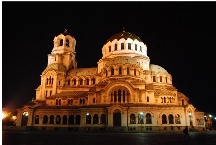
首都标志性建筑——涅夫斯基教堂

首都索非亚，人口约132.5万，是保加利亚政治、经济、文化中心。第二大城市是普罗夫迪夫，第三大城市是瓦尔纳。