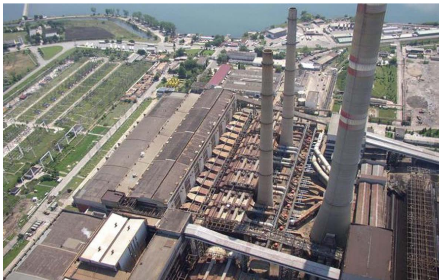
浙大网新承建保加利亚最大火电站烟气脱硫项目

根据保加利亚统计局数据，2020年，中国对保加利亚直接投资(FDI)流量为-880万欧元，同比下降182 %；中国对保直接投资存量1.18亿欧元，较上年基本持平。